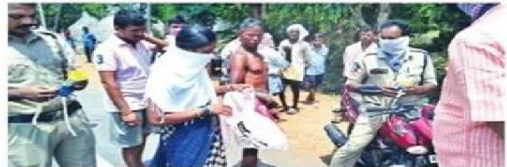
మాస్కులు పంపిణీ చేస్తున్న సమీర స్వచ్ఛంద సంస్థ సభ్యులు