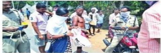
మాస్కులు పంపిణీ చేస్తున్న సమీర స్వచ్ఛంద సంస్థ సభ్యులు