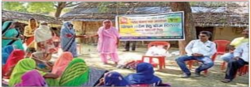
उत्तर प्रदेश सरकार के वनार लते बहुत में किसानों को किचन गार्डन किट का वितरण किया गया।