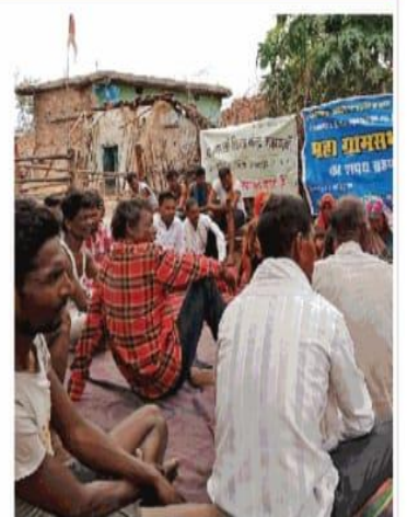
महाग्रामसभा रोरिया में अचार बनाने के संबंध में बैठक करते आदिवासी। • नवदुनिया

महुआ के अचार को सरसों तेल, सरसों, मैथी वाने, लाल मिर्च, सौंफ, हल्दी पाउडर, अमचूर, नमक के साथ पाश्चात्य कृत आदिवासियों ने तैयार किया है। इसका स्वाद खट्टा-मीठा है।