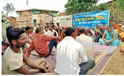
महाग्रामसभा रोरिया में अचार बनाने के संबंध में बैठक करते आदिवासी।